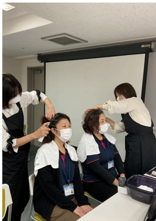
ヘッドマッサージ

今回、初めての試みでスキンケア体験を行いました。化粧品会社より、ビューティーカウンセラーさんをお招きして、「ヘッドマッサージ」こちらは目がぱっちり開き、口角も上がり髪もツヤツヤになったと、大好評でした。あとは、「簡単眉メイク」こちらは実際に眉の形を整えてもらい、皆さん大満足の様子でした。次回は、2月に開催予定です。