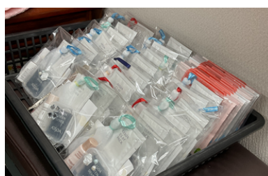
化粧品サンプルセット