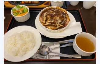
昼休憩は院内の喫茶店エスポアールで。ランチはお腹いっぱいになるボリューム。種類もおすすぬ。何を食べても美味しい。