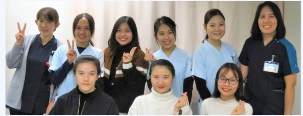
グループ病棟の技能実習生、特定技能生実習指導者さんと交流会を行いました

5. 日本の良いところ教えてください。 ※観光地や食べ物、日本人のことなどどんなことでも (横浜と東京は綺麗なところだと思っています。皆さんは優しい親切だしとても助かります。) 6. 日本に来て学びたいことは何ですか？ (私の字や話し言葉は日本語と違います)