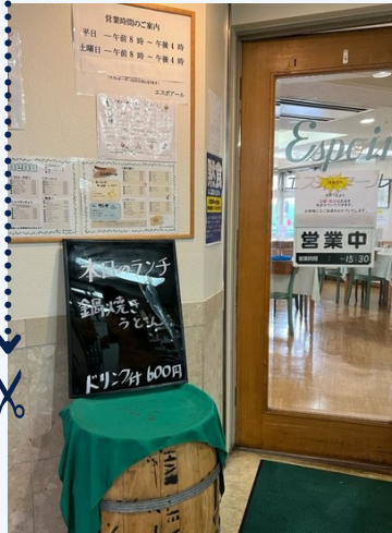
エスポアール入口